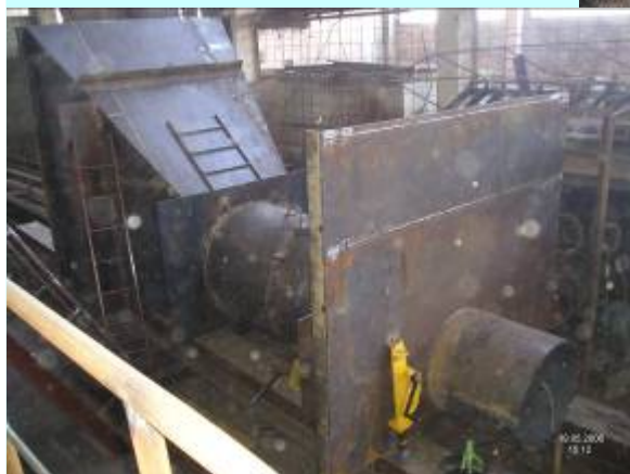
Контроль изготовления металлоконструкций руслового оголовка