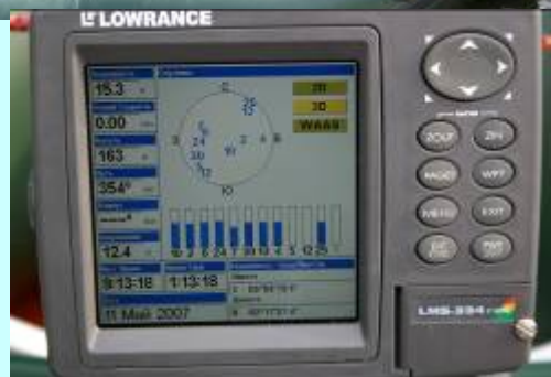
Промеры глубин эхолотом и разметка прохода плавсредств с использованием GPS