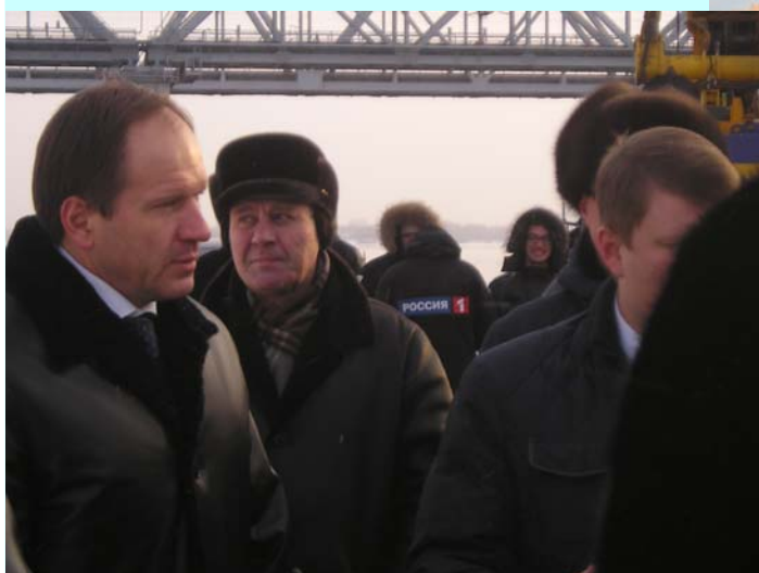
Губернатор Красноярского края Л.В.Кузнецов на площадке строительства 4 моста.