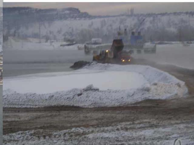
Покорение Енисея велось и в мороз.