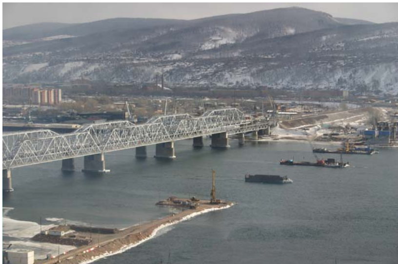
Вид на технологические площадки 8, 9, 10.

Строительство 4 автомобильного мостового перехода через р. Енисей.